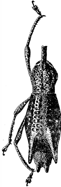
Abb. 1, Leprosomus spinipennis n. sp. Vergr. 6x.

Auf eine bisher beschriebene Art vermag ich die vorliegende nicht zu beziehen. Der Rüssel ist unten vor der Basis zahnartig erweitert. Nach Faust (Deutsche Ent. Z. 1892, p. 21) weisen nur zwei Arten: sulcicollis Fst. und aries Guér. dieses Merkmal auf.